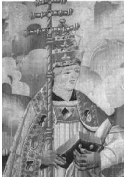
Gregor I. (um 600)

2. Gregor I. (um 600), er hat durch umsichtige Verwaltung und Abrundung des großen päpstlichen Grundbesitzes innerhalb und außerhalb Italiens Mittel erworben, mit denen er sowohl großzügig soziale Ausgaben tätigen, als auch die Stadt gegen die Langobarden verteidigen konnte. Damit hat er, wenn er auch noch die Oberhoheit des byzantinischen Kaisers anerkannte, schon den