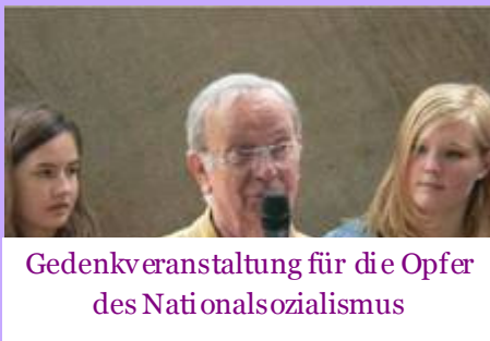
Gedenkveranstaltung für die Opfer des Nationalsozialismus