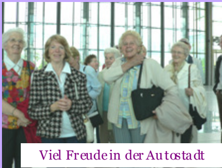
Viel Freude in der Autostadt