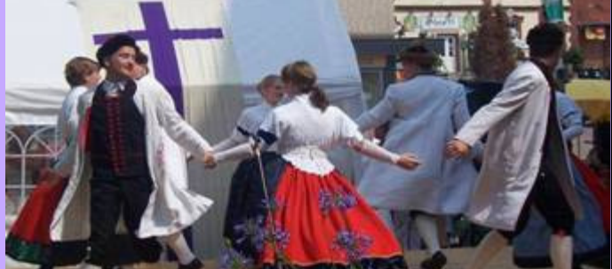
Die Dorfjugend Heeßen