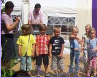
Die Kindergartenkinder singen vom Regenbogen

begeistern. Genau das gelang unserer Kirchengemeinde auf ihrem Gemeindefest mit großem Flohmarkt. Im Programm war für jeden etwas dabei. Musik und Gesang vom Posaunen- und Gospelchor der Kirchengemeinde, Darbietungen von den Trachtentänzern der Dorfjugend Heeßen und vom Ev. Kindergarten. Der Flohmarkt mit seinen vielen interessanten Angeboten lockte die Besucher. Wobei es die Älteren eher