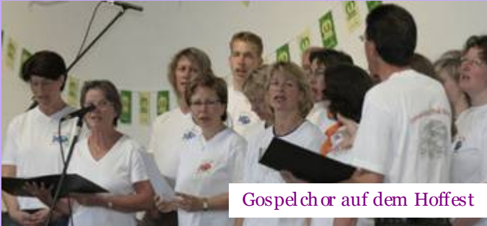
Gospelchor auf dem Hoffest

Ahnen-Süd | Bad-Eilsen | Heeßen | Luhden | Schermbeck