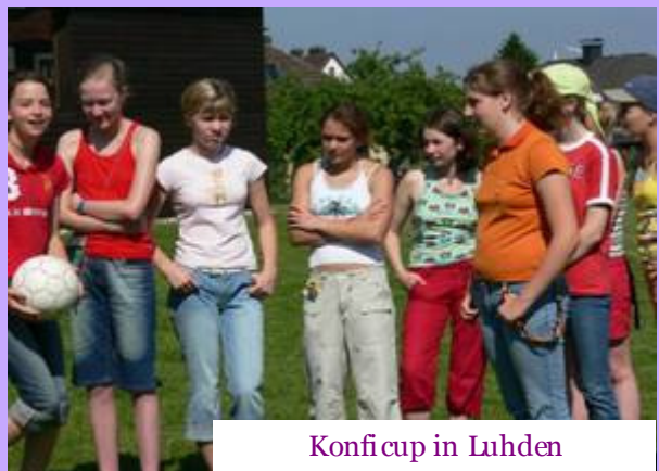
Konfigcup in Luhden

Termine, Gottesdienste, Urlaubsfoto Aktion und vieles mehr