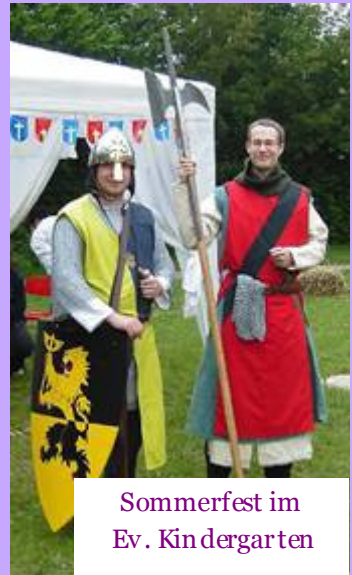
Sommerfest im Ev. Kindergarten