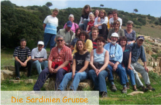
Die Sardinien Gruppe

des Familienkreises der Ev. Kirchengemeinde Bad Eilsen