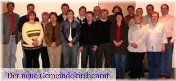
Der neue Gemeindegkirchenrat

Ahnen-Süd | Bad-Eilsen | Heeßen | Luhden | Schermbeck