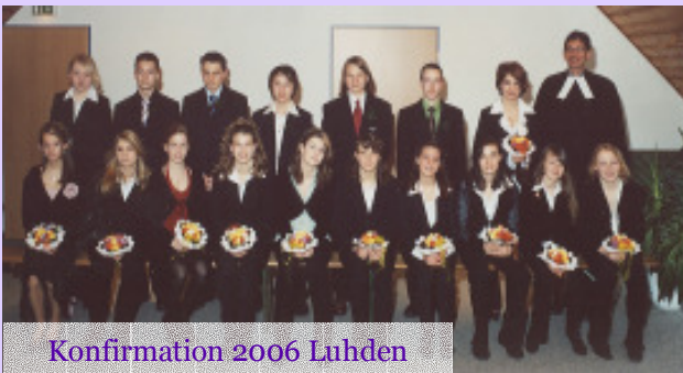
Konfirmation 2006 Luhden