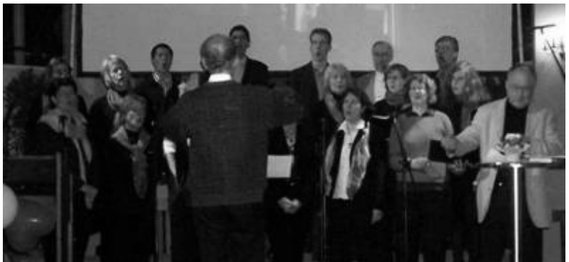
Der Gospelchor unserer Kirchengemeinde bei Pro Christ