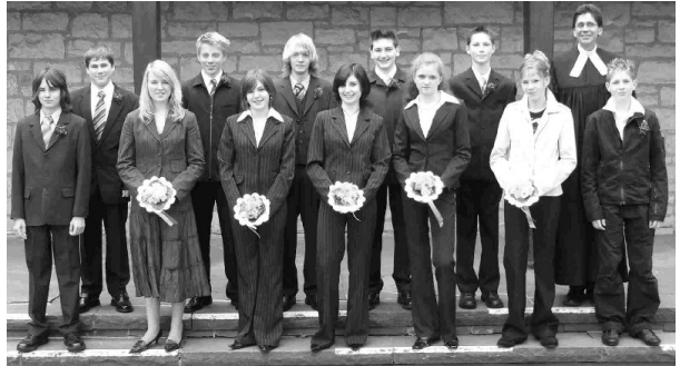
Konfirmanden 2006 Bad Eilsen

Der Konfirmationsgottesdienst stand unter der Überschrift: „Das Glück unseres Lebens“.