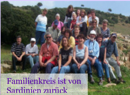
Familienkreis ist von Sardinien zurück