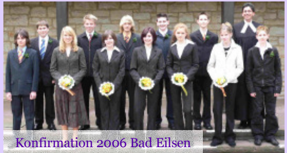
Konfirmation 2006 Bad Eilsen